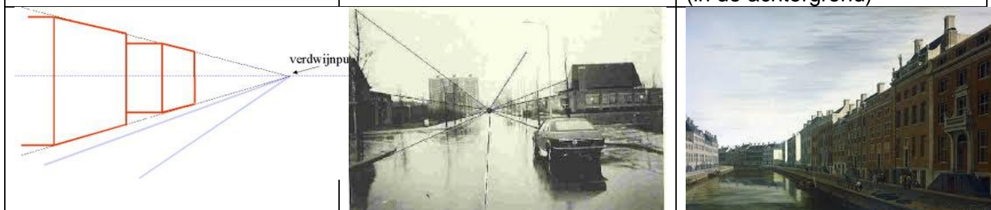
Groot (in de voorgrond) klein (in de achtergrond)

Hierboven zie je drie voorbeelden van lijnperspectief. Met behulp van de horizon en verdwijnpunten wordt er ruimte gesuggereerd op een wiskundig uitgemeten manier.